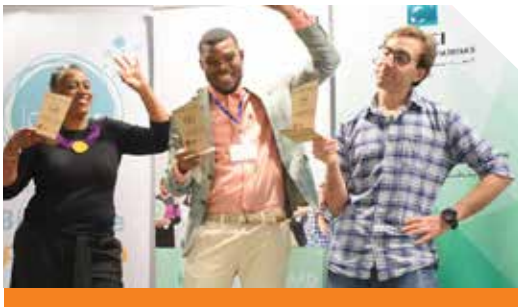
Lauréats édition 2019

En marge du 1 er Prix, le jury a attribué le Prix «Coup de cœur» au projet «Climb'In» qui ambitionne de créer une salle de sport spécialisée dans l'escalade de bloc visant à démocratiser le sport de montagne en Tunisie. Enfin, le Prix «Coup de Pouce» est revenu au projet «LEBRA» qui oeuvre à la création de collections de bijoux et d'accessoires à partir de matériaux de récupération, chutes de cuir essentiellement.