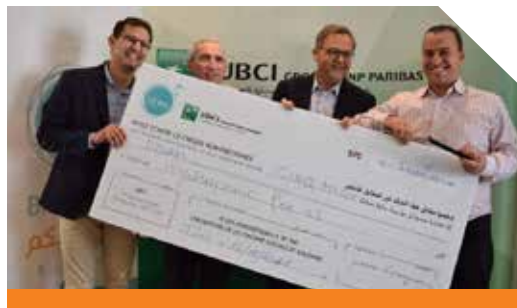
Lauréat édition 2018

fins d'autoproduction, a séduit le jury. Deux autres prix ont été décernés par le jury : le Prix « Coup de pouce » au projet « Sciencia » dans le secteur de la promotion de l'expérimentation scientifique et le Prix « Coup de cœur » à « Cha9a9a.tn », unique plateforme de financement participatif en ligne en Tunisie.