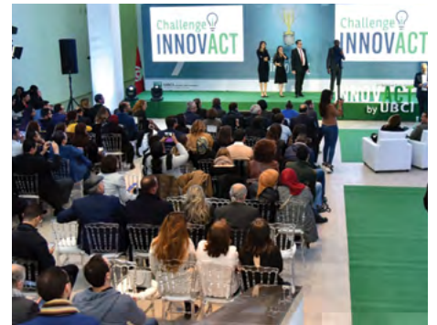
Road Show effectué au niveau des grandes écoles et universités de Tunis

Les collaborateurs de la banque impliqués ont ainsi partagé leur expertise au sein d'une expérience collective innovante, leur permettant de diversifier la pratique quotidienne de leur métier.