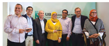
Les 3 lauréats du concours

Suivez toutes les actualités UBCI sur www.ubci.tn et sur les réseaux sociaux