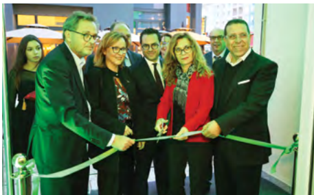
Cérémonie de coupe du ruban d'inauguration en présence de la Direction Générale UBCI