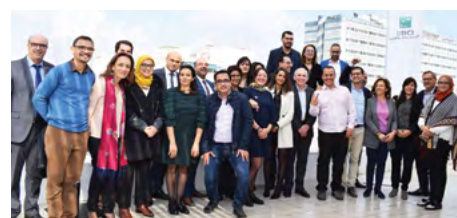
Participants et Membres du jury du Prix UBCI - LAB'ESS de l'Entrepreneur Social

Engagée de longue date dans une stratégie responsable et pérenne d'accompagnement de l'entrepreneuriat social, l'UBCI confirme là son engagement de participer à la construction d'un monde plus durable .